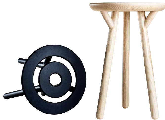
Arriba, objetos de vidrios basados en el sistema de colores RGB, que incluso estuvieron expuestos en la Saatchi Gallery (Londres). Debajo, cubilete de silicona para bolígrafos y candelabro Duo, ambos de Doiy. Sobre estas líneas, el taburete Aro, en negro y haya, realizado a mano, uno de sus objetos de más éxito. Y a la derecha, la lámpara CL, con pie adaptable a múltiples posiciones.