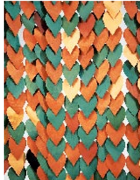
Arriba, taburete de tres patas de pino y boga. Sobre estas líneas, cortina realizada a base de hojas de cuero. A la izquierda, taburete desmontable en pino. Abajo, tetera de cerámica blanca con ilustraciones de hojas de té, gotas de agua y fuego, y una versión en cuero y fieltro de la tradicional hucha de cerdito.