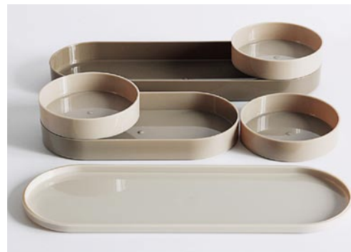
Los nuevos modelos de chimeneas de Gandía Blasco llevan su firma (arriba). Para Omami ha diseñado este conjunto de platos y bandejas apilables (sobre estas líneas).